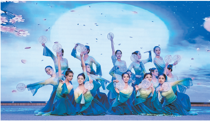
23级幼二班舞蹈《清庭云月》