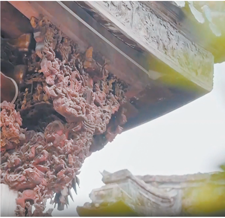
广济桥亭台楼阁的木雕装饰