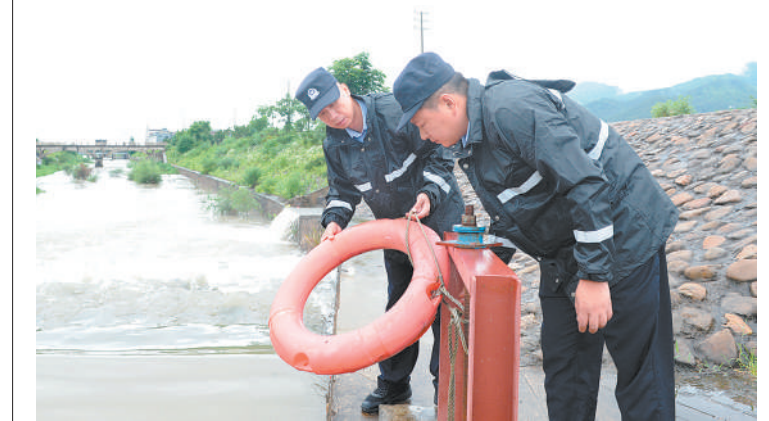
24日，市公安局鹿鹿派出所民辅警冒雨深入辖区各大小山塘、水库排查汛期隐患，做好各项安全防范措施。图为民警在白溪江边检查应急救援设施。