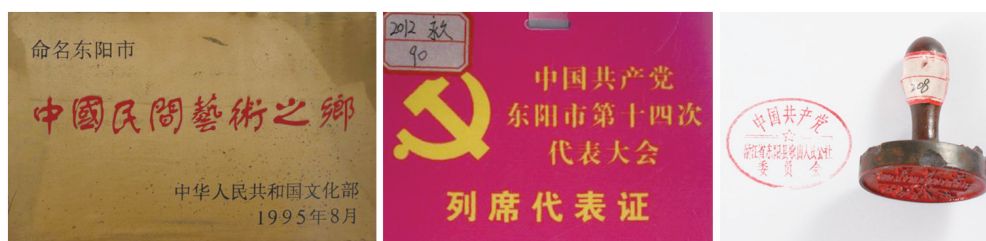
东阳被命名为中国民间艺术之乡奖牌 中国共产党东阳市第十四次代表大会列席代表证 印章档案

2.档案实物。党章、奖章、勋章、证书、工作证件、代表证件、纪念品、印章、票据（各历史时期使用的代币券、粮票、购物券）、契约、地图、牌匾等；革命斗争过程中的实物，如战斗用具、肩章、臂章、生活用品等。