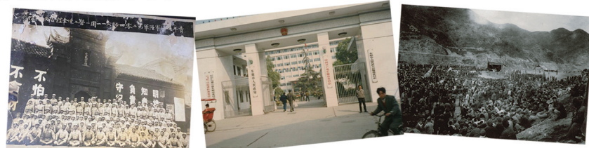
士兵大合影 老市政府照片 修建横锦水库誓师大会