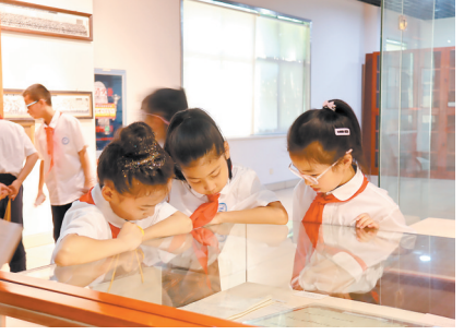
学生参观市档案馆