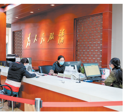
市民在市档案馆查阅档案